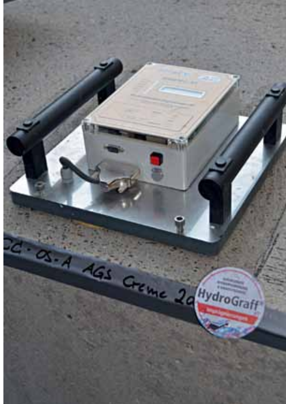
HydroGraff OS-AGS and HydroGraff FL OS-AGS Liquid were successfully tested on test surfaces and in practice

Scheidel GmbH & Co. KG Jahnstr. 42 96114 Hirschaid/Germany ☎ +49 9543 8426-0 info@scheidel.com ➔ www.scheidel.com